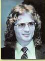
Sahte mesih David Koresh (üstte) ve yanan evi (yanda)