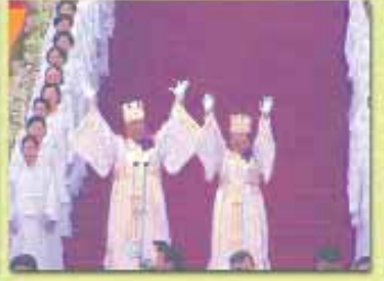
Dünya çapında örgütlenmeye sahip olan Moon tarikatının ku- rucusu Sun Myung, tören es- nasında (yukarıda)