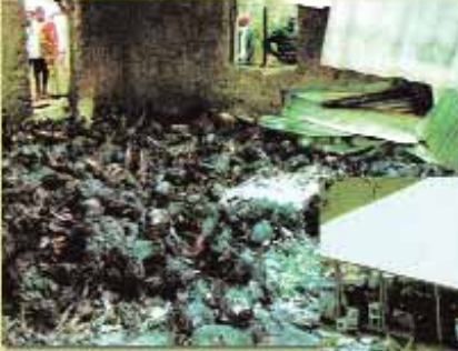
Üstte Uganda'da bulu- nan toplu mezar ve sağda Jim Jones ta- raftarlarının intiharı görölmektedir.